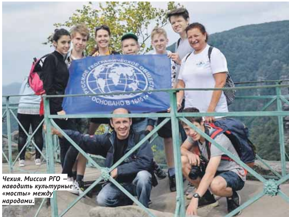
Чехия. Миссия РГО — наводить культурные «мосты» между народами.

Виталий СОЛОВОВ