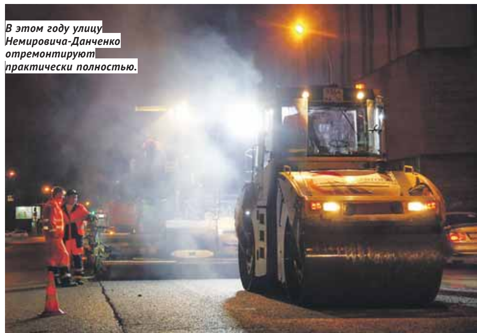
В этом году улицу Немировича-Данченко отремонтируют практически полностью.

Страницу подготовил Виталий ЗЛОДЕЕВ