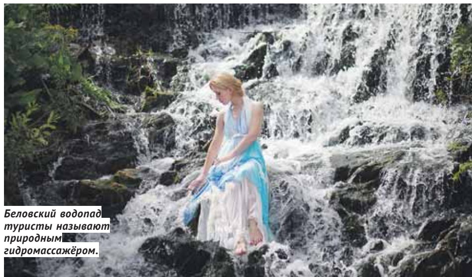
Беловский водопад туристы называют природным гидромассажёром.

Лагерем с палаткой можно встать у самого водопада, чтобы слышать умиротворяющий шум воды. Но будьте осторожны, территория у водопада усыяна мелкими острыми камешками, поэтому лучше всего