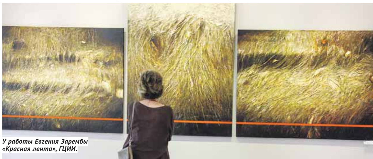
У работы Евгения Зарембы «Красная лента», ГЦИИ.

Живописные пейзажи, воды, рыбы и люди — в середине июля в Новосибирске открылась целая серия замечательных художественных выставок.