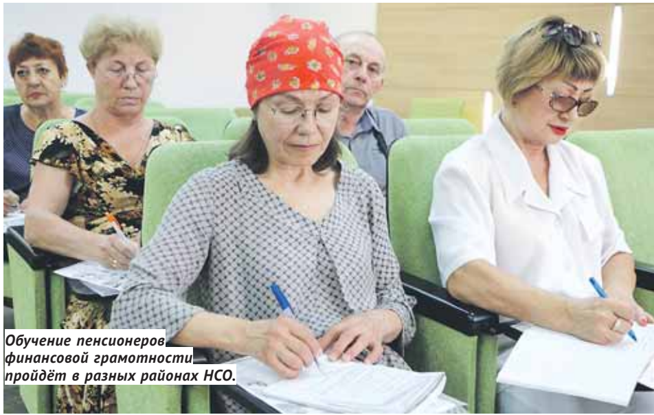
Обучение пенсионеров финансовой грамотности пройдёт в разных районах НСО.

Министерство труда и социального развития Новосибирской области совместно с ПАО Сбербанк организовали обучающий курс по финансовой грамотности для людей старшего поколения. «Ведомости» побывали на первом занятии курса.