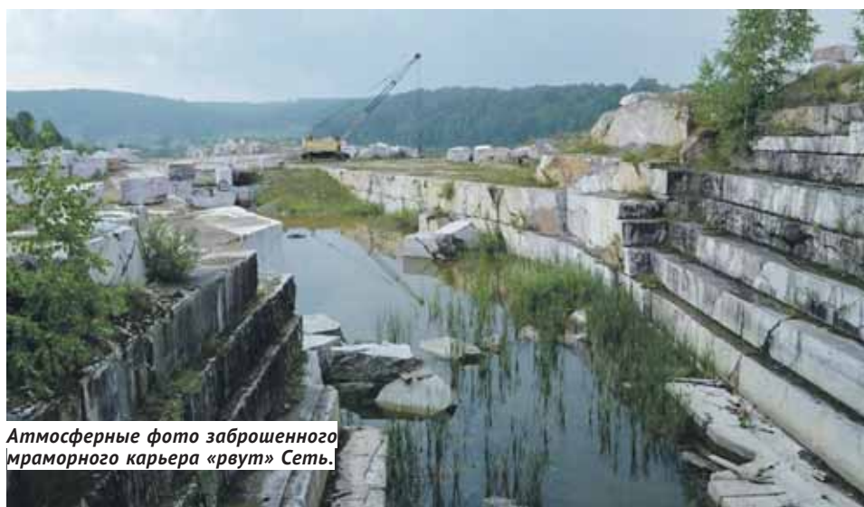
Атмосферные фото заброшенного мраморного карьера «рвут» Сеть.

дала трещину — и образовался водопад около 10 метров в высоту, ставший местной достопримечательностью. Пруд, из которого вытекает водопад, — отменное для рыбалки место: говорят, попадаются карпы такой величины, что не выдерживают снасти. С севера и востока пруд окружен сосновым лесом с выходом скальных пород и обилием грибов.