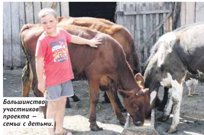
Большинство участников проекта — семьи с детьми.

▶ Можно отправить SMS на номер 7715 с текстом «НОВОСИБИРСК (пробел) СУММА». Например: «Новосибирск 500». Указанная сумма будет списана с баланса вашего мобильного и направлена на расчётный счёт фонда «Защити жизнь».