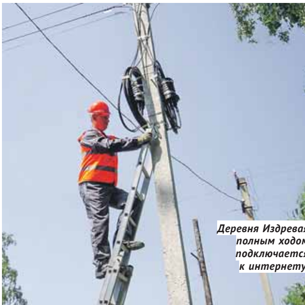
Деревня Издревая полным ходом подключается к интернету.

При этом Издревая отнюдь не захолустье, можно сказать — ближайший пригород Новосибирска, но интернета нормального качества здесь не было никогда, как и в сотнях других сёл и деревень области. Но благодаря федеральному проекту «Устранение цифрового неравенства», реализуемому «Ростелекомом», и обла-