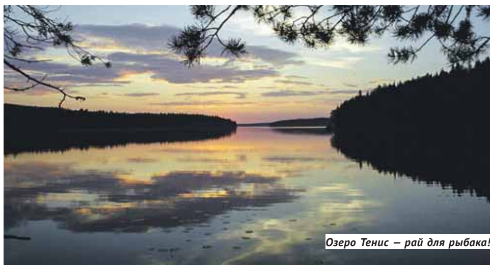
Озеро Тенис — рай для рыбака!